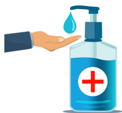
Utiliser une solution hydroalcoolique

NOUS VOUS RAPPELONS 4 GESTES SIMPLES À ADOPTER LORS DE VOTRE SÉJOUR À L'HÔTEL