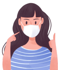
Le port du masque est obligatoire