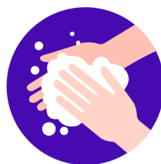
Se laver régulièrement les mains